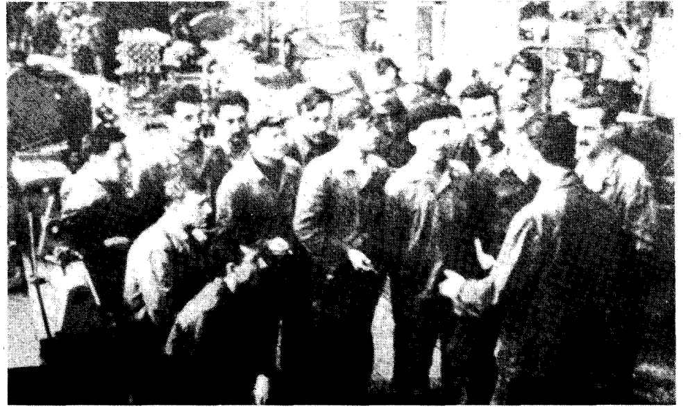
Ouvriers dans une usine de moteurs yougoslave. La récente vague de grèves est dirigée contre les brutales mesures d'austérité dictées par le Fonds monétaire international.

La Yougoslavie est devenue le maillon faible de la domination stalinienne en Europe de l'Est. Des décennies de "socialisme de marché" et de soi-disant "autogestion ouvrière" en ont fait une région de désastre économique. Les tensions et les conflits nationaux augmentent. La politique étrangère de "non-alignement" a, dans la pratique, accentué la dépendance vis-à-vis du capitalisme occidental. Avec la mort du maréchal Tito en 1980, c'est un atout important