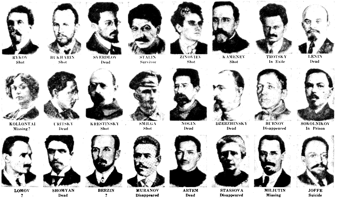
The Central Committee of The Bolshevik Party in 1917