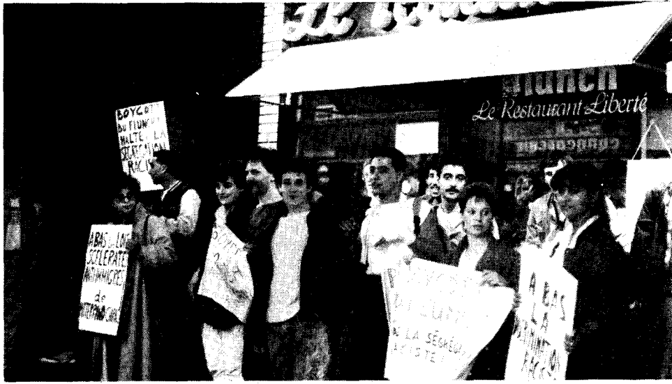
Dix jours de suite, la LTF a organisé un piquet antiraciste devant le Flunch de Rouen.

Quant aux sociaux-démocrates et pseudo-révolutionnaires regroupés autour du Collectif antiraciste, la manifestation du 4 juin a montré leur lamentable faillite. La LCR et ses alliés dans ce collectif ont tout fait pour nous exclure de leurs réunions pour le "crime"... d'être passés à l'action antiraciste et d'avoir été à l'initiative du boycott du Flunch. Ledit collectif a alors boycotté le boycott du Flunch -- une position heureusement non partagée par une centaine de Beurs, jeunes Noirs, militants politiques et syndicalistes. En outre, la LCR et le collectif ont tout bonnement scissionné la manif (qui était après tout organisée par le MRAP). Et sur quelle base? Vouloir substituer le palais de justice à la préfecture comme point de chute de la manifestation? Mais il n'y a pas la moindre différence politique! Qu'après des semaines d'inactivité quasi totale ils aient été relégués à la queue de la manif du MRAP et du PC "renforcés en nombre par la LTF", comme l'écrit Rouge (n°1261, 11-17 juin), c'est en fait, comme le poursuit l'hebdomadaire de la LCR, "parce que le collectif a été ces derniers temps paralysé, traversé de débats et de tergiversations quant à l'opportunité d'appeler rapidement à une riposte de masse". Une admonestation, à peine voilée, de la direction nationale de la LCR contre sa section rouennaise! Heureusement la LCR a ensuite surmonté son sectarisme et a protesté contre l'assignation du Bolchévick.