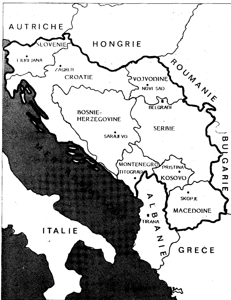
En Yougoslavie, les divisions nationales sont aggravées par le "socialisme de marché".

quiers étrangers d'aller se faire voir et elle doit mettre de l'ordre dans l'économie du pays. En l'absence d'une telle perspective, les grèves et les actions ouvrières alimentent une effervescence sociale qui pourrait déchirer totalement la Yougoslavie et ouvrir la porte à la contre-révolution capitaliste. Car le désastre économique n'a pas seulement déclenché des luttes ouvrières, il a aussi exacerbé