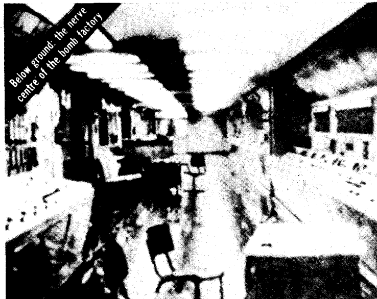
Photographies de la fabrique souterraine israélienne de bombes nucléaires, dans le désert du Néguev, publiées par le Sunday Times de Londres le 5 octobre 1986.