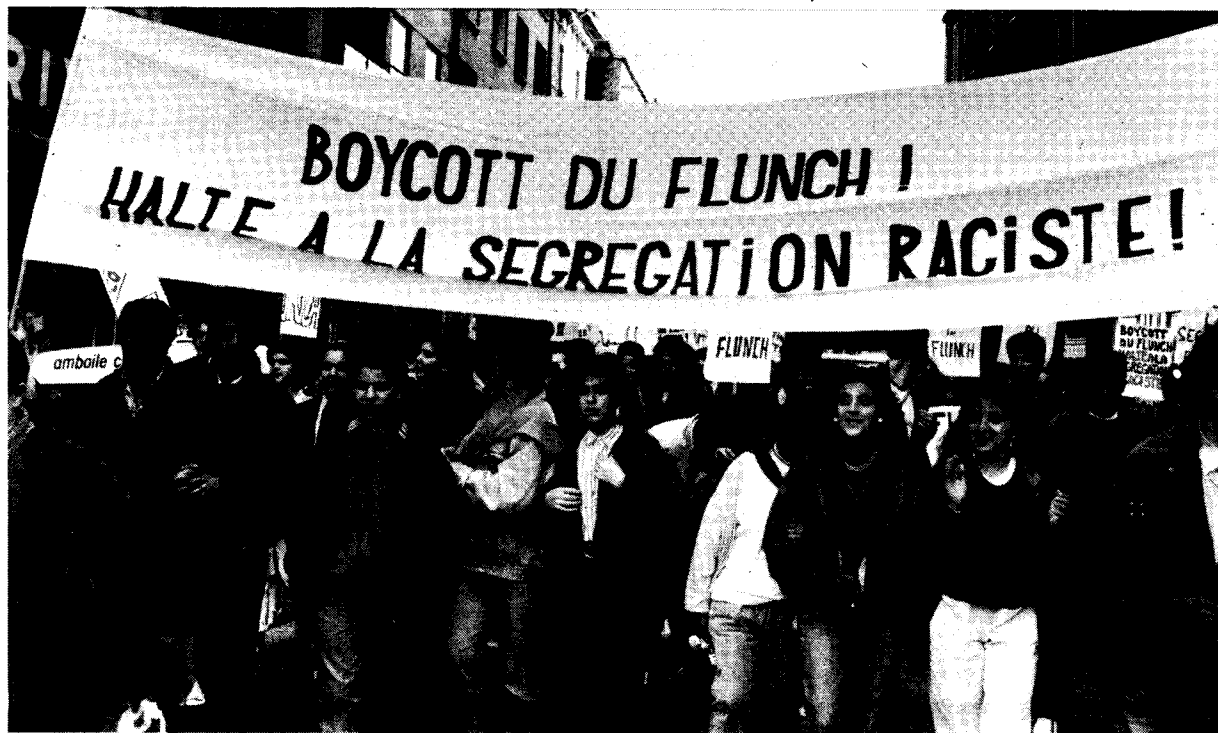
Rouen -- A la manifestation du 4 juin appelée par le MRAP. Les Beurs mobilisés par la LTF contre le Flunch raciste.

Nos camarades de Rouen appelèrent à la riposte: "Dans le contexte de la montée de Le Pen, dont les meetings sont régulièrement suivis de ratonnades (comme à Marseille et à Lyon), il faut réagir dès maintenant contre cette scandaleuse discrimination raciale [...]. Dès lundi, chaque jour, il faut une mobilisation devant le Flunch, pour appeler au boycott de ce restaurant raciste." Tous les jours pendant près de deux semaines, de 19 à 20 h, environ cent personnes (dont de nombreux Beurs) manifestèrent devant le Flunch, scandant des mots d'ordre comme "Boycott du Flunch!", "A bas la ségrégation raciste!", "Pleins droits de citoyenneté pour les immigrés!" Une bonne partie