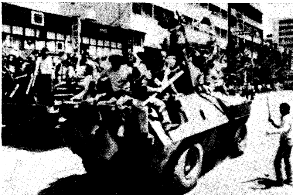
Pendant le soulèvement de Kwangju, en 1980, ouvriers et étudiants capturent des véhicules de l'armée.

Dans la Corée du Nord à régime stalinien, dirigée par les autres "deux" Suite page 14