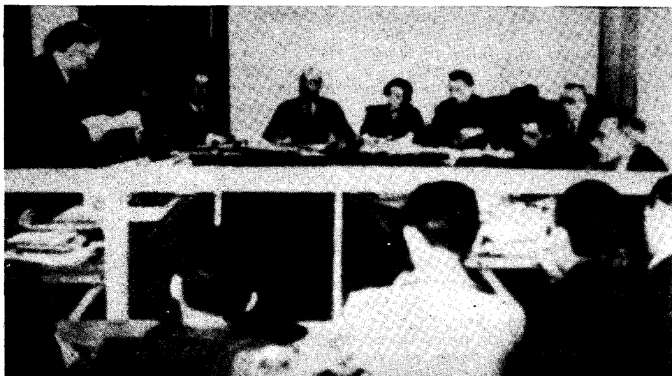
Trotsky déposant en 1937 devant la commission Dewey, qui prouvera que les procès de Moscou de Staline étaient une monstrueuse machination.