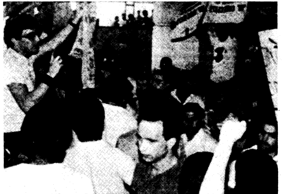
Jérusalem, 18 mai — Sous le mot d'ordre "Halte à la politique d'apartheid!", des étudiants arabes et juifs de l'université hébraïque protestent ensemble contre la politique raciste antiarabe sur les droits universitaires.