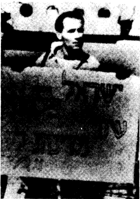
Vanunu en 1985, dans une manifestation pour les droits des Palestiniens à l'université Ben-Gourion de Beersheba. Sur le panneau: "Israël-Palestine. Deux Etats pour deux peuples."

Le jour même j'ai pris l'avion Suite page 6