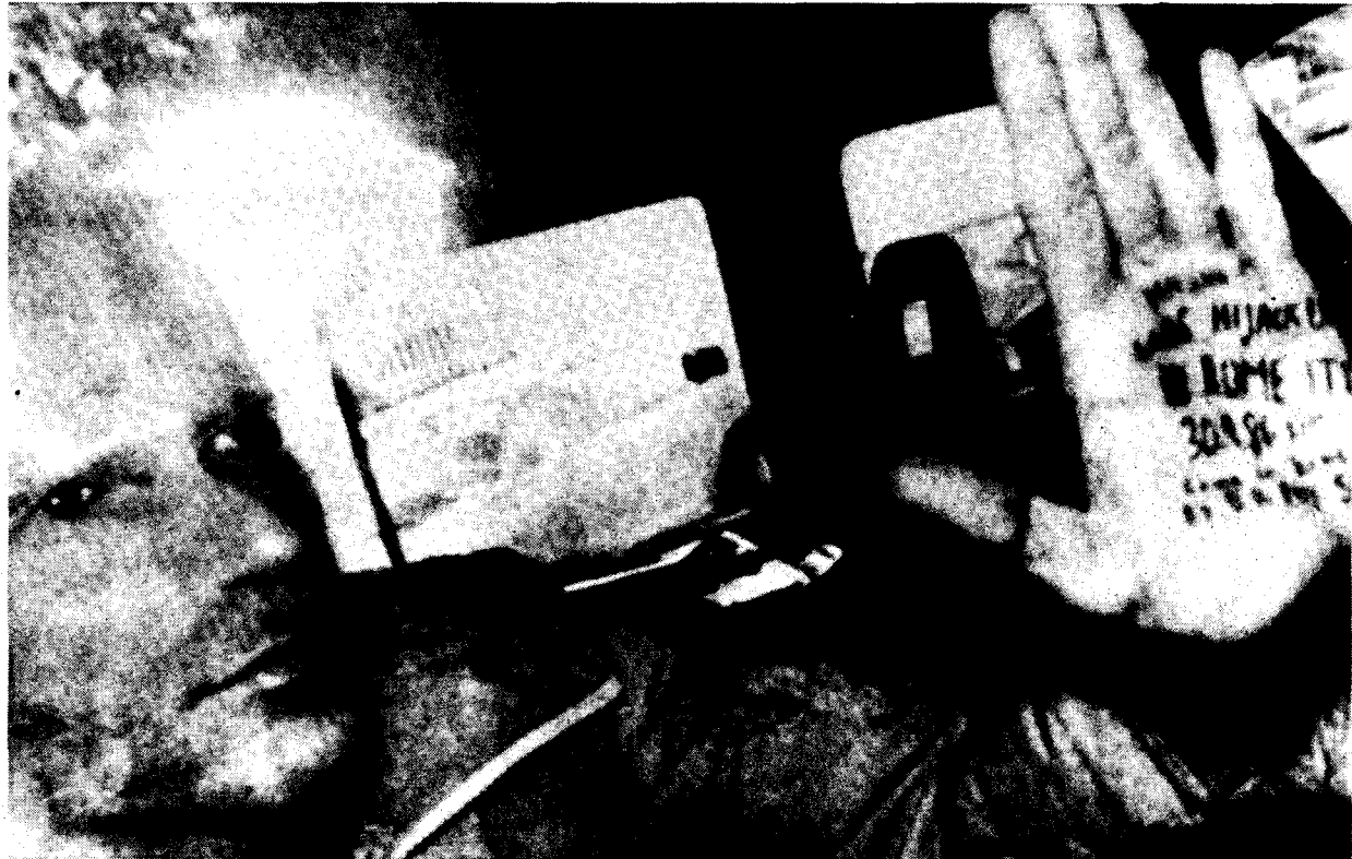
Jérusalem, novembre 1986: Mordechaï Vanunu, le courageux technicien nucléaire israélien, fait passer à travers la vitre d'une voiture de police un message aux journalistes affirmant qu'il a été kidnappé à Rome par des agents israéliens.

Il risque la peine de mort pour avoir dit la vérité : Israël a la bombe !