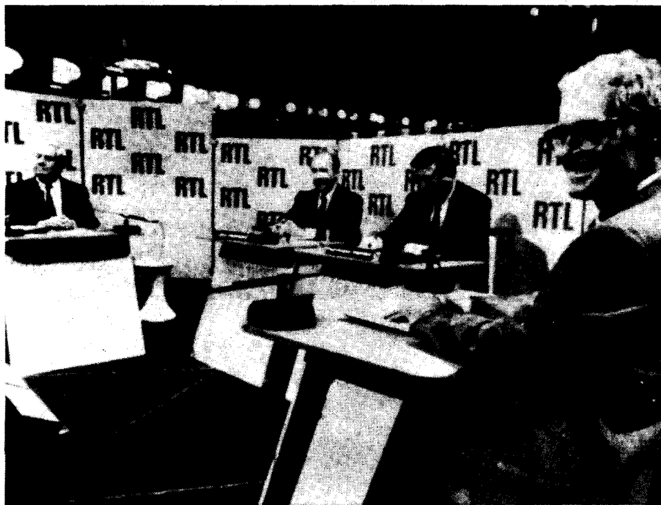
Matin de Paris

Le PCF a lancé sa campagne sur le thème "Le Pen vous ment". Mais les fascistes se moquent pas mal d'être "démasqués". Leur force ce n'est pas leur argumentation politique, c'est l'action. Le Pen, mieux que tous les "démocrates" et réformistes réunis, a compris l'utilisation de la tribune parlementaire ou des "débats" télévisés comme haut-parleurs pour ses appels à l'action extra-